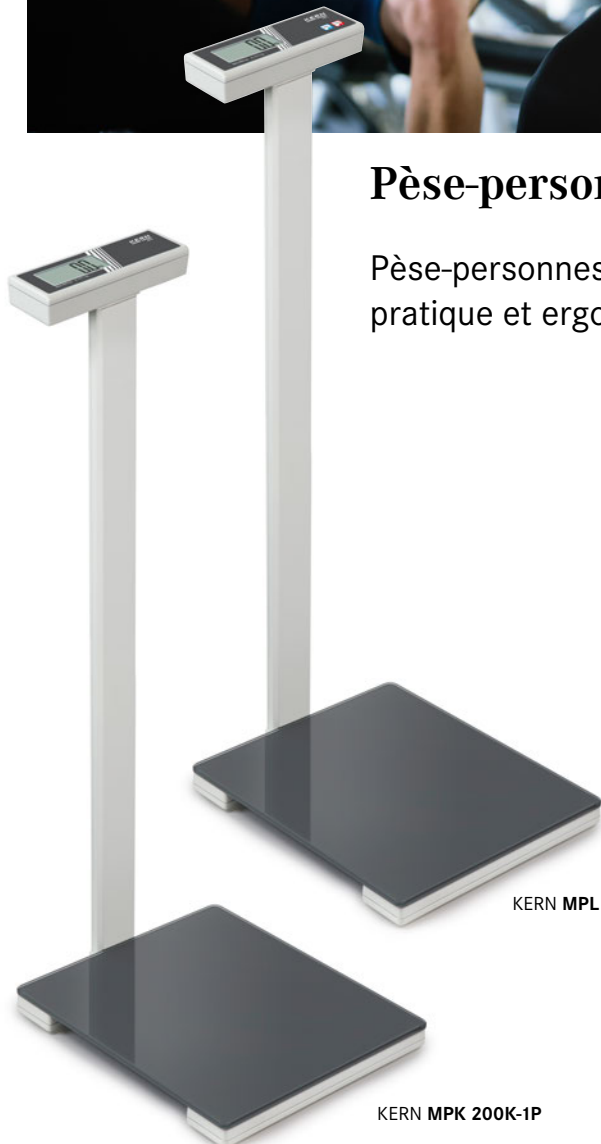
KERN MPL 200K-1P

Pèse-personnes à colonne pour une utilisation pratique et ergonomique