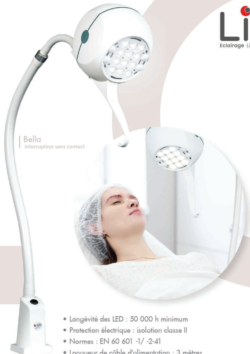
Bella interrupteur sans contact